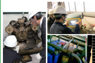
▲使用設備やエア漏れ等をチェック