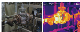
▲サーモグラフィによる温度計測