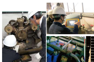
▲使用設備やエア漏れ等をチェック