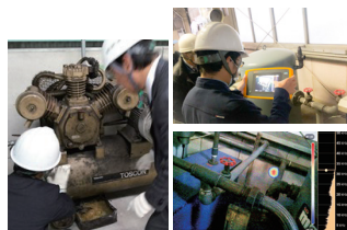
▲使用設備やエア漏れ等をチェック